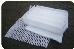
스펀지 등의 포장재