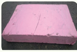
코팅 및 타재질 스티로폼